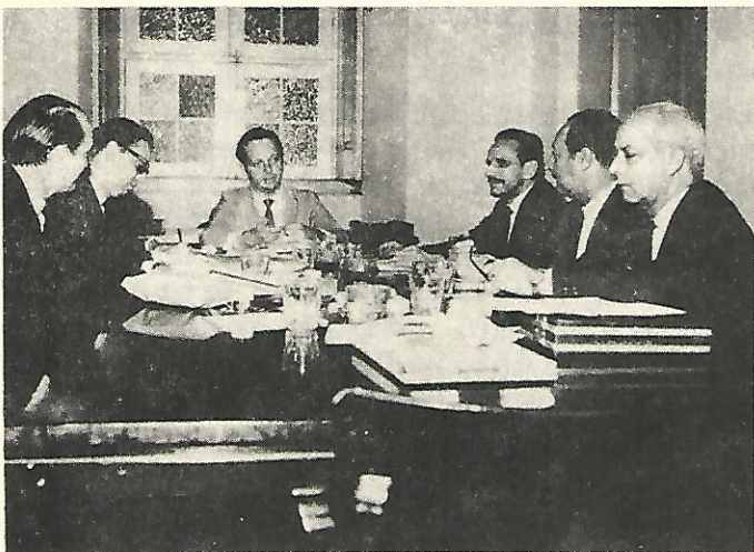
ASPECTO DE UMA REUNIÃO DE DIRETORIA. COMO SE PODE NOTAR PELAS FISIONOMIAS DOS PARTICIPANTES, OS ASSUNTOS TRATADOS SÃO SÉRIOS.

Todo mês, rotineiramente, de acôrd com calendário aprovado no início do ano, a Diretoria se reúne para discutir os as- suntos em pauta. Estes assuntos, em geral, foram examinados previamente em reuniões setoriais, quando cada Diretor em despacho com o Presidente tem oportunidade de discutir em detalhe os que lhe estão afetos. Com esta sistemática, a reunião mensal passa a ter um rendimento maior pelo encami- nhamento objetivo que os temas recebem.